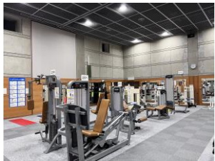
マシントレーニング